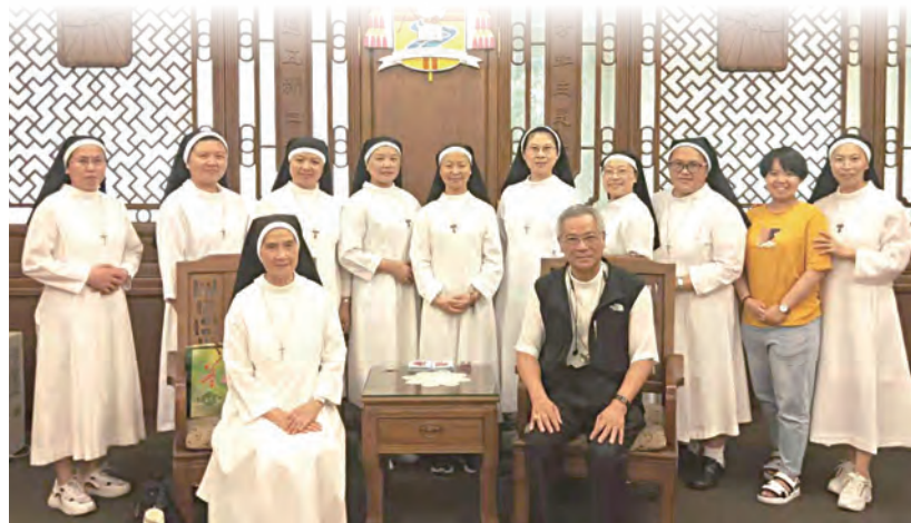
▲感謝大家長洪山川總主教的接待及朝聖安排

行走在《找到自己，找到天主》的心路歷程當中！葉神父的宣講、見證，生動具體地為我們指明了擺在我們腳前的這條邁向與自己、與團體、與大地萬物、與天主聖三的合一共融之路、悔改之路、補贖之路。「師傅引進門，修行靠個人」，的確，天主藉神父的口說給我們的話，「確實是生活的、是有效力的，比各種雙刃的劍還銳利，直穿入靈魂和神魂，關節與骨髓的分離點，且可辨別心中的感覺和思念。」(希4:12) 盼藉神師的帶領、宣講、陪伴和見證，讓我們的心被喚醒、被更新、被裝備，賴天主恩寵的助佑，在我們每個人的生命內發生效力、持續發酵，直到被釀成新酒，裝進新皮囊內！沒錯，我們必須承認擺在我們面前的這條路，又窄又長，崎嶇難走，但耶穌已經在我們之前走過，歷代聖人聖女們也已經走過、經歷過，如今他們已經獲得了永恆生命的榮冠；