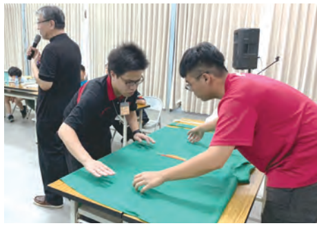
▲讓學員試著鋪放祭衣