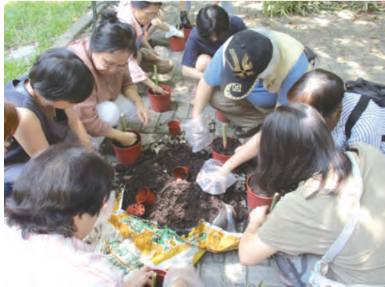
▲聖文生中心的學員們栽種聖賀德佳所推薦的高良薑 ▲新竹瑪利亞方濟各修院裡的迷宮，適於靈修默想。