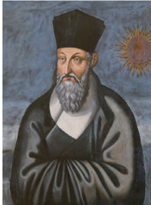
▲收藏在羅馬耶穌會總部的利瑪竇遺像真跡