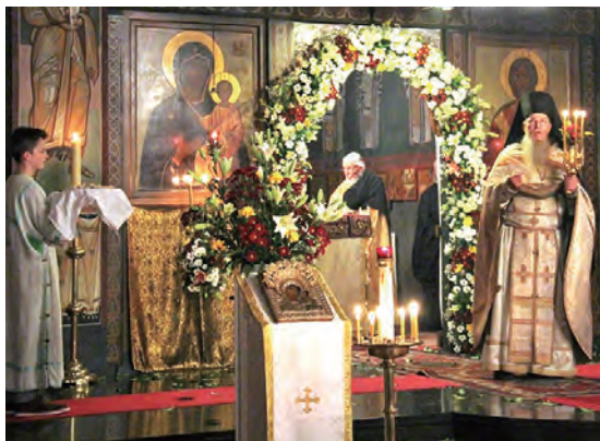
▲圖5：金色禮服以宣報主耶穌基督復活了！