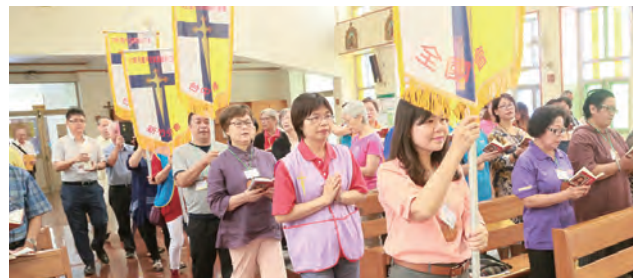
▲開幕式由各分會主任舉著分會會旗進場

基督活力運動在台灣已有50多年歷史，此運動的主旨：是完全奉獻，追求理想，實踐愛德。這次全國勵志會的主題是：創意研讀《聖經》，度基督徒生活。