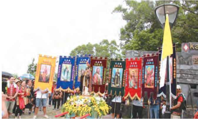
▲來義堂區各分堂旗幟