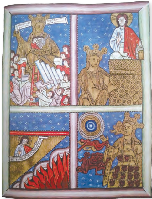
▶聖賀德佳的第12幅神視圖，慈母教會中的聖事