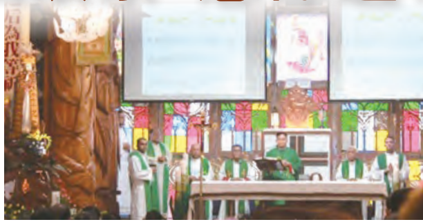
▲劉主教主持隆重感恩祭典

表演的團體有泰武堂區、蜀國鄉民、桃源堂區、霧台堂區、來義堂區、泰武古謠吟唱、泰武堂區職青「安bir bir樂團」、瑪家堂區等，大家無不使出渾身勁或跳或唱好不熱鬧。其中尤以泰武堂區「安bir bir」最吸引在場群眾的目光，團員語帶幽默地說自己是「寬板條」，因為「安bir bir」的意思就是「胖胖的」，團員都是在工作的社會職青，平時不容易聚在一起，這次臨時起意的組隊成軍，湊巧大家的體型都是圓滾滾的，所以才取團名為「安bir bir」，就是希望大家能記住他們，語畢，引起大家的哄堂大笑，隨後跟著節奏與群眾起舞歡唱打成一片，將氣氛帶到最高潮。他們口中的「杜爸爸」——杜勇雄神父的口袋歌曲也不遑多讓，一開口唱〈再給我一個機會〉，大家頓時為之瘋狂，尖叫聲不斷，接著，一首接一首引頸高歌，聽得在場群眾如癡如醉，欲罷不能。