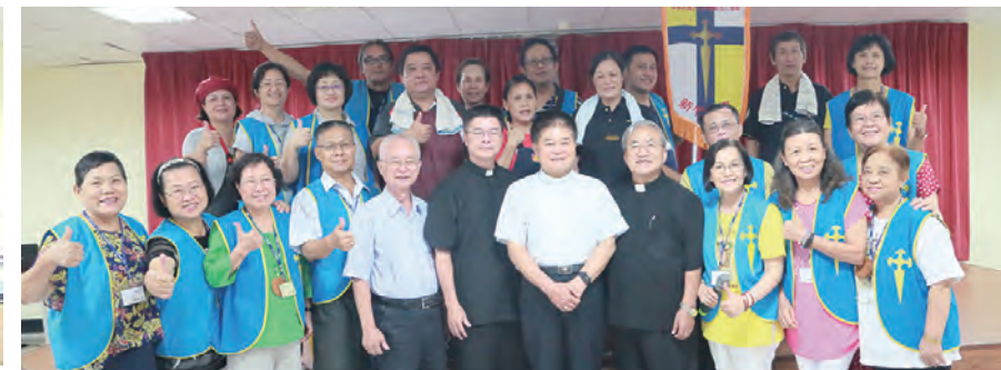
▲新竹分會與會代表及神長合影留念