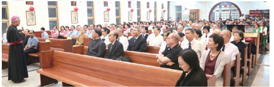
▲洪山川總主教呼籲「氣候行動」刻不容緩。 ▲來自多哥共和國的狄傳道神父闡述地球危機

濟成長。但如今我們面對地球暖化，必須在「乾淨水資源、海洋生態、陸地生態、氣候變遷對策」等議題刻不容緩地採取行動。