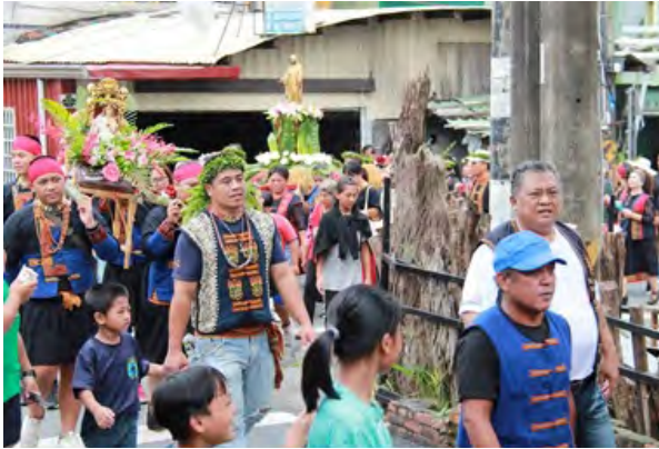
▲聖像態像繞村遊行