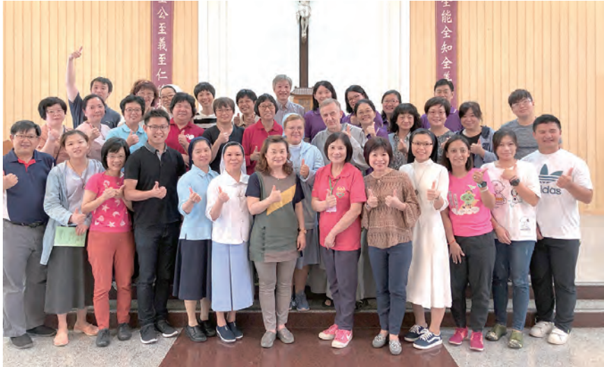
▲大家歡喜結業齊聲說讚