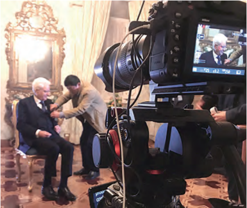
▲拍攝《利瑪竇傳》劇組赴羅馬，專訪義大利總統塞爾焦·馬達雷拉。