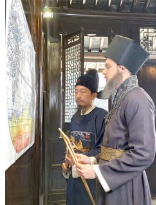
▲拍攝《世界坤輿圖》場景 ▶位於羅馬的聖依納爵大教堂