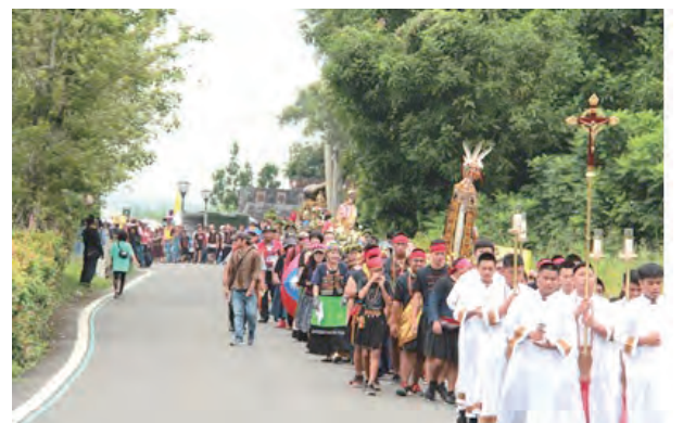
▲遊行由輔祭團作前導