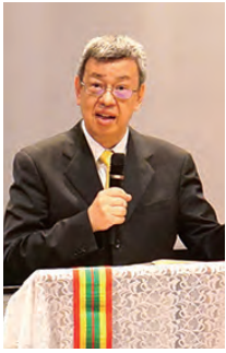
▲陳建仁副總統致詞鼓勵發揚原住民族文化,一起傳愛。