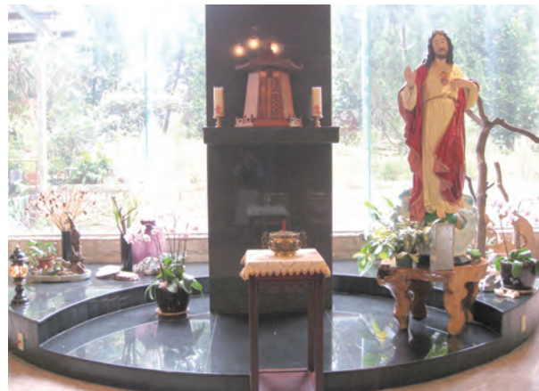
▲新竹寶山區的聖女小德蘭朝聖地美麗聖母山