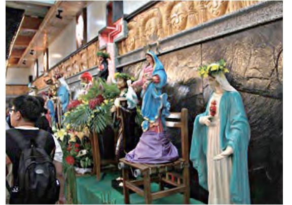
▲各堂以聖母為名的態像齊聚