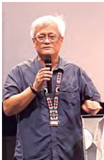
▲監察院孫大川副院長感謝傳教士們對原民文化的貢獻