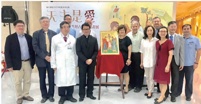
▲教廷駐華代辦佳安道蒙席（左四）參與聖像畫展開幕禮，讚譽有加。