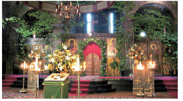
▲圖6：五旬節（聖神降臨節）以綠色為主。

首先，讓我們先稍微認識一下拜占庭禮聖職人員的穿著。據雪維凍泥爾（Chevetogne）修道院出版的《東方天主教會——金口聖若望感恩祭禮典》說明：拜占庭禮中，不論執事、神父或主教皆著及地「長袍」（ le sticharion ，希臘文：στικχάριον），等同於拉丁禮神父的長白衣（拉丁文： alba ），但相對更華麗些。接著，袖口繫上「護腕套」（ les épimanikia ）（圖1），綁帶纏繞的繩索表示倚靠來自天主的力量。令人印象較深刻的是在修院的禮儀進行時，數次看見執事甩動披在左肩的一條帶子，即所謂的「禱帶」（ l'orarium ，希臘文：όράριον）（圖1）。