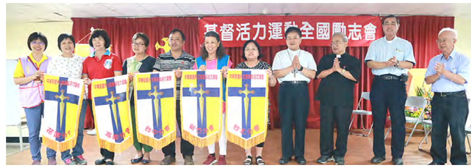
▲全國7個分會代表合影留念