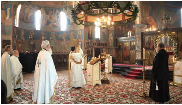
▲圖4：以白色禮服歡慶復活期第四主日。