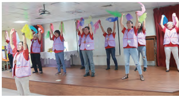
▲花蓮分會表演「彩帶舞」風靡全場。

有位越南女孩嫁到台灣23年，因為未得教會允許，她每主日參與彌撒而不敢去領聖體，因為她把天主放在首位。有位才華橫溢的教友，神父請他幫忙福傳，他說等我退休，等退休了，又說我要帶孫子，孫子大了又說我養了一隻狗