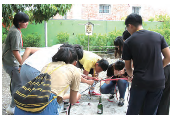
▲營隊活動：團體遊戲