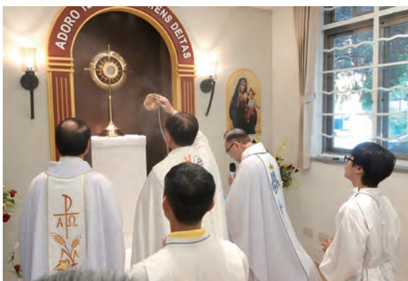
▲全體在恆久朝拜聖體小堂虔誠舉行明供聖體。

教會從14世紀就開始推動聖體敬禮，但被人們漸漸疏忽，忘了愛德福傳的力量源自天主恩寵；1981年12月1日聖教宗若望保祿二世以身作則，在羅馬聖伯多祿大殿創設了恆久朝拜聖體小堂；教宗提醒我們「恆久的朝拜聖體，是所