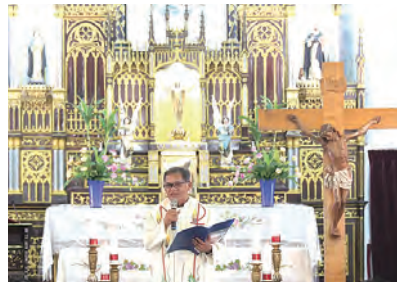
▲溫馨開幕禮開啟高雄教區福傳新頁

當天，甫於8月10日新上任的教廷駐台代辦佳安道蒙席亦特地出席，這是他首次蒞臨高雄教區；黃忠偉副主教介紹新任代辦簡歷，佳代辦隨即以英語致詞，錢盛義