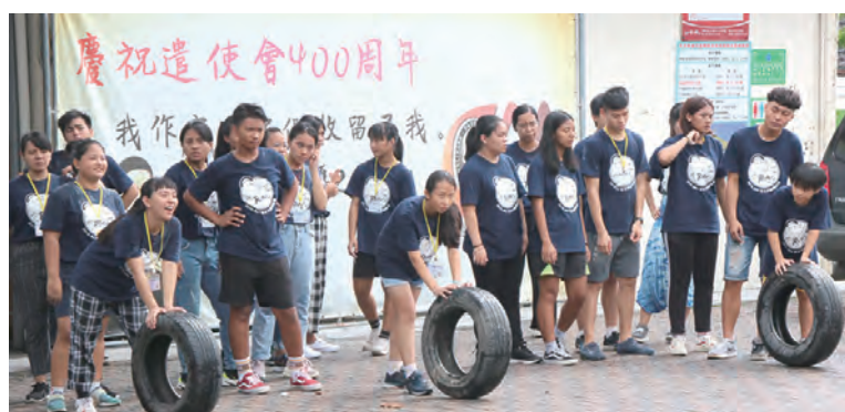
▲營隊活動：趣味競賽

青年是教會及社會富裕與青春朝氣的源泉，聖教宗若望保祿二世頒布《基督信友平信徒》勸諭，明示青年是教會的希望，教會的勸諭是強而有力的，我要向所參加活動的青年們說：「青年們！讓天主聖神帶領你們善用自我才能及愛主愛人的心，來服務聖教會和他人，向友誼、團體保持正義、真理及和平的價值觀面對現代的挑戰，要記住，你不是一個人，主耶穌時刻與你同在，使你成為教會的福傳工作者。」讓我們繼續保有聖文生的精神傳愛給需要的人，期待著第2屆遣使會青年共融體驗營！