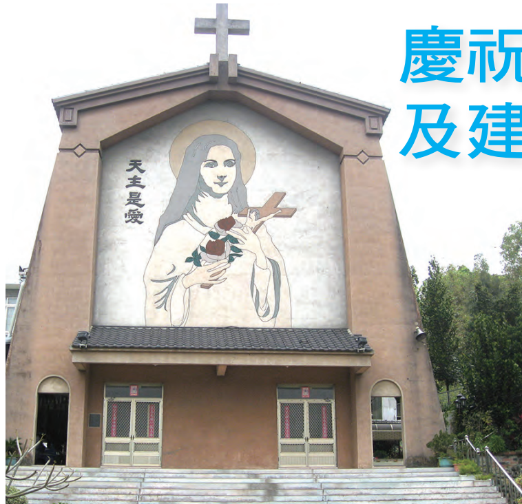
▲至聖所獨特的設計，引人心靈沈澱與主相遇。