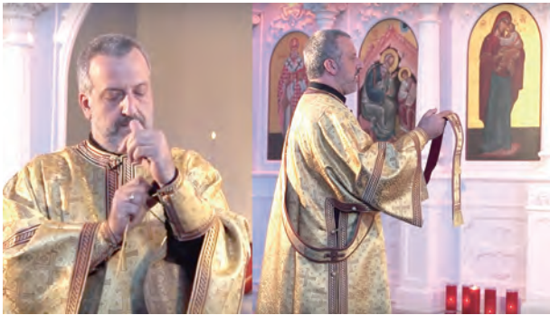
▲圖1：執事配戴的護腕套（左）及禱帶（右）。

禮儀總與服飾離不開關係，穿衣在文化上是種禮節。無論在東方禮或拉丁禮中，禮服的選用，並非取決於個人喜好，而是與教會的節期大有關係，並含有其更深一層的象徵含義。