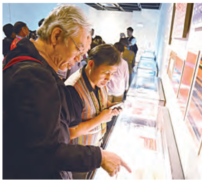
▲豐富多元的陳列品,展現了原住民族部落以愛福傳的人文軌跡。

為響應聯合國2019年「原住民語言國際年」,也慶祝天主教來台開教160周年,台灣教會自9月28日起,在順益原住民博物館舉辦為期1個月的2019年「天使傳愛在部落——原住民族語與福傳」文物展。