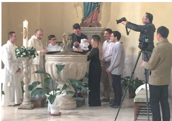
▲劇組在馬切拉塔教堂拍攝利瑪竇誕生的場景再現

隨著製作腳步，拍攝團隊一路上經歷許多奇異恩典；其中一位德籍年輕作曲家海納·格蘭欽（ Rainer Granzin ）正是被利瑪竇的故事所感動，而答應創作16首紀錄片配樂。海納出身於