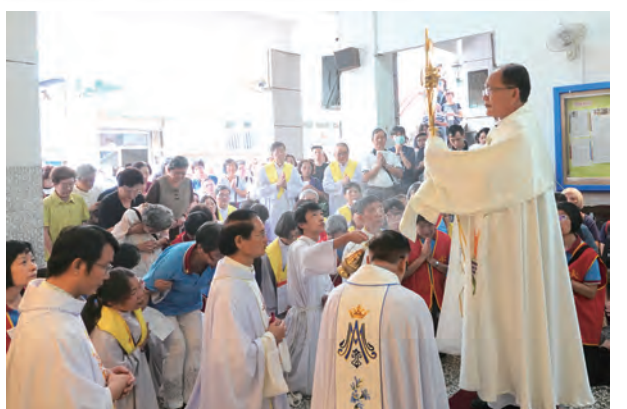
▲蘇耀文主教親自走向大家行聖體降福，令人動容。

目前暫訂每天14小時朝拜聖體，每星期有90小時，看到輪值時間表都被大家填滿了，真令人感動，感謝大家熱切朝拜聖體；即使沒有事先在輪值表上登記的教友們，也歡迎隨時前來朝拜聖體，希望敬禮聖體的果效，使堂區的信仰與靈修都能有所成長。