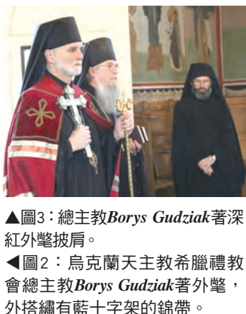
▲圖3：總主教Borys Gudziak著深紅外髦披肩。 ▲圖2：烏克蘭天主教希臘禮教會總主教Borys Gudziak著外髦，外搭繡有藍十字架的錦帶。